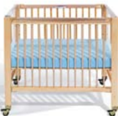
Moyenne 38 cm