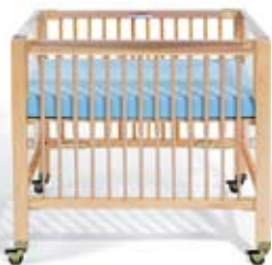
Elevée 23 cm

Le même lit peut servir pour des nouveaux nés ou pour des bébés plus grands. Réglage de la hauteur avec sécurité enfant, aucun outil nécessaire.