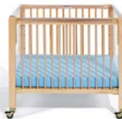
Basse 56 cm

Remarque : La hauteur du matelas des lits d'évacuation n'est pas réglable.