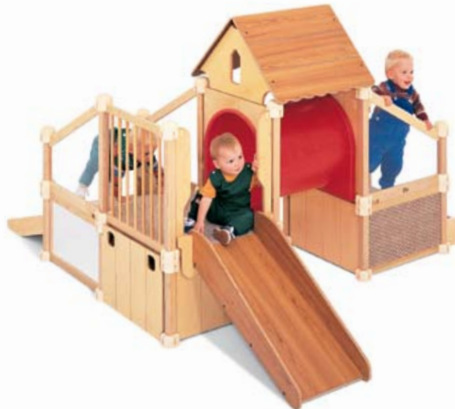
■ ■ Équipement de gym pour jardin d'enfants 3 G730 Préciser la couleur du tunnel, rouge ou beige.

Ces équipements de gym pour jardin d'enfants sont compacts et permettent aux enfants de relever des défis physiques adaptés à leur âge comme des escaliers, des toboggans et des rampes inclinées.