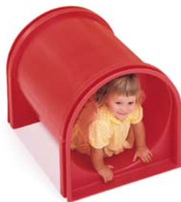
Tunnel de gym rouge G752 Tunnel de gym beige G753

Les miroirs intriguent les tous petits et encouragent des jeux visuels comme des parties de cache-cache.